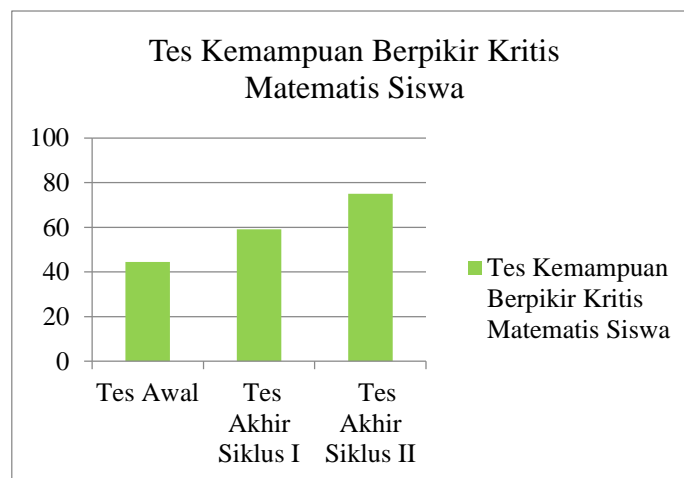
Gambar 2. Perbandingan Skor Rata-Rata Kemampuan Berpikir Kritis Matematis Siswa Setiap Siklus

Adapun tabel nilai rata-rata hasil tes kemampuan berpikir kritis matematis siswa disajikan dalam tabel dibawah ini: